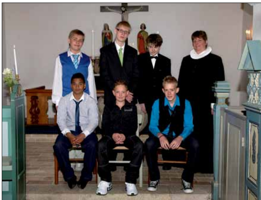
Konfirmanderne fra Øster Velling kirke den 15. maj 2011