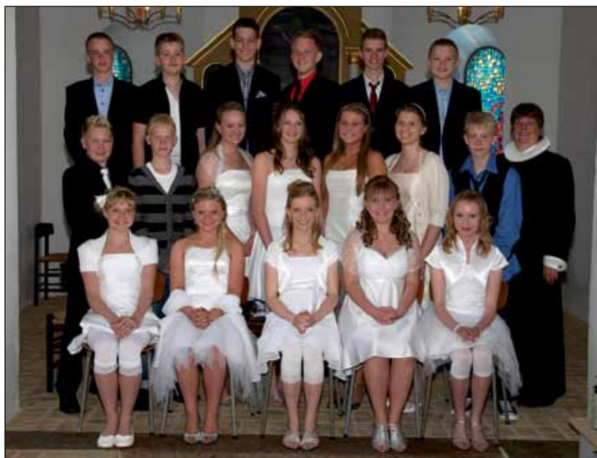
Konfirmanderne fra Grensten kirke den 20. maj 2011